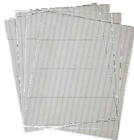
WIP-POLY-ESD-140-4 WIP-POLY-ESD-140-6 WIP-POLY-ESD-140-9 WIP-POLY-ESD-140-12

Tamaños disponibles: 4 x 4" 9 x 9" 6 x 6" 12 x 12"